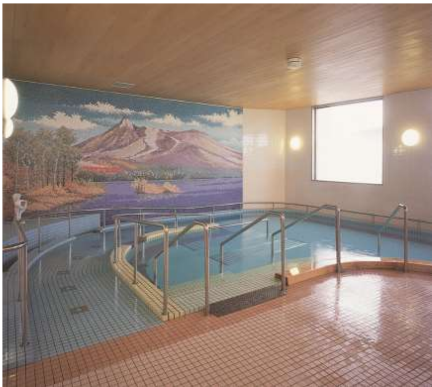
スロープ付き浴室