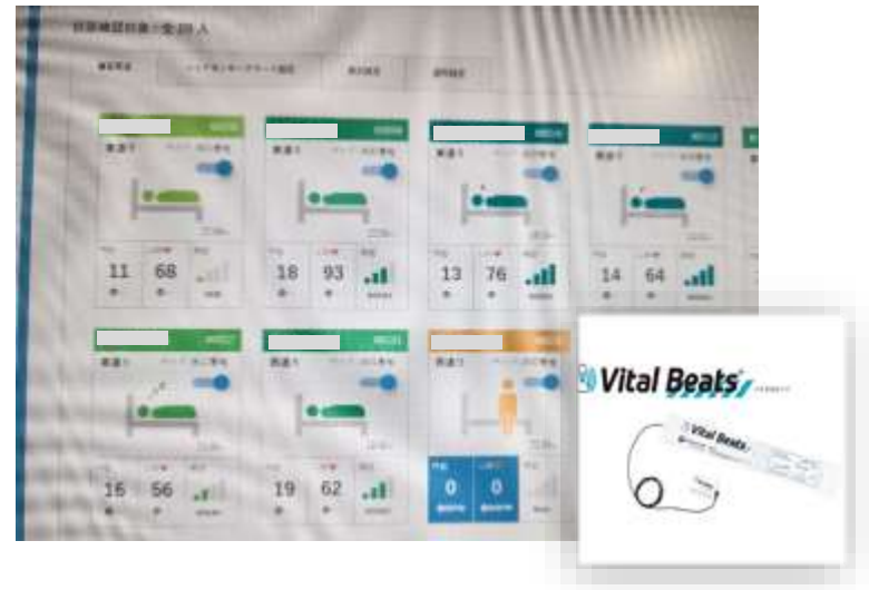
介護見守り用ベッドセンサー