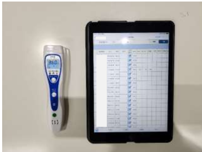
通信機能付きバイタル測定器