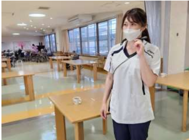
遠隔コミュニケーションツール